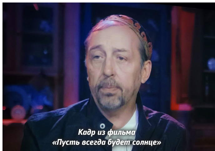
Кадр из фильма «Пусть всегда будет солнце»