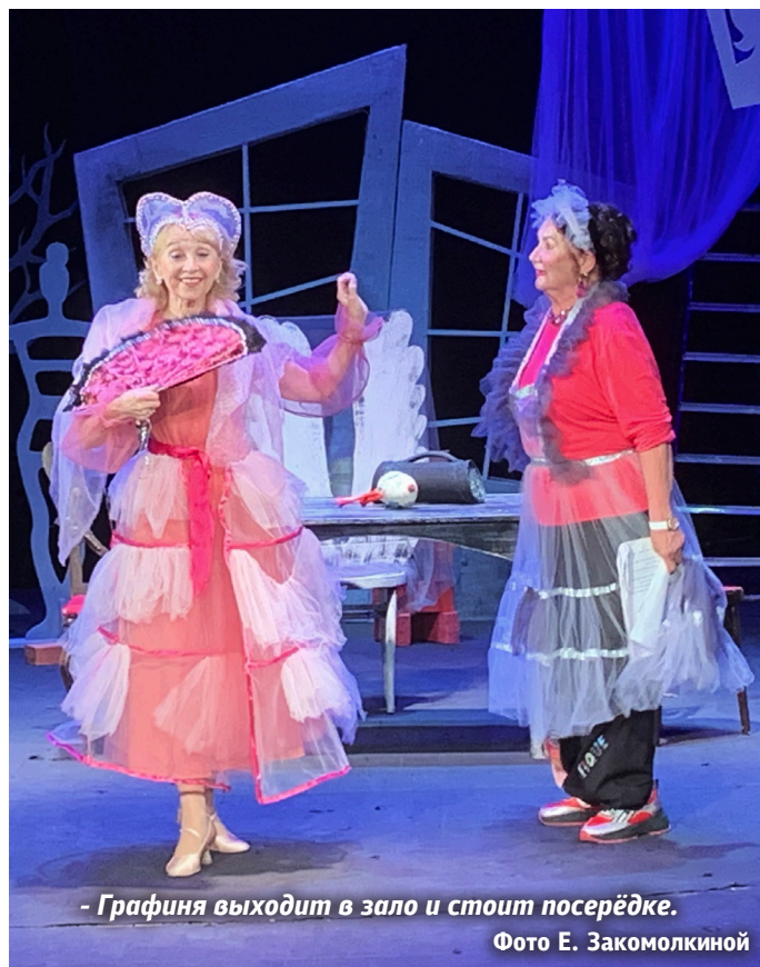
- Графиня выходит в зал и стоит посередке.